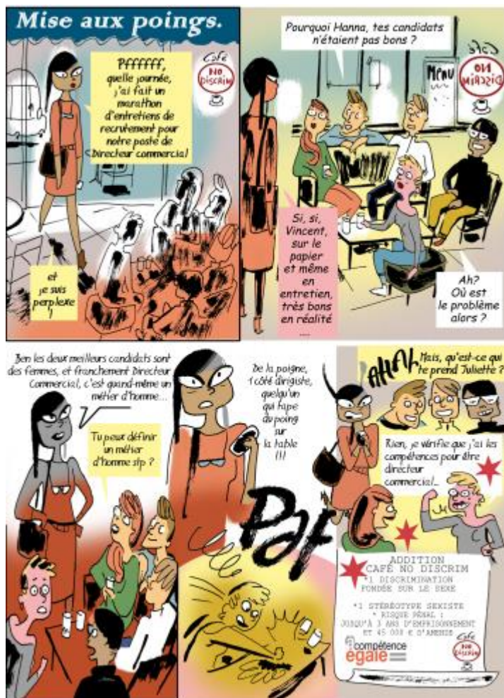
Planche n°1 : discrimination basée sur le sexe

Sensibiliser, attirer l'attention, expliquer, alerter, dénoncer des pratiques, prévenir des risques légaux encourus, tel est l'enjeu de ces 24 planches de BD au ton décalé et humoristique.